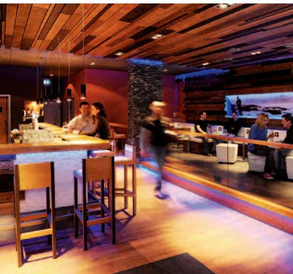
53 Prozent der Befragten sagen aus, dass sie in die Erneuerung des Interieurs und der Innenräume investieren werden.