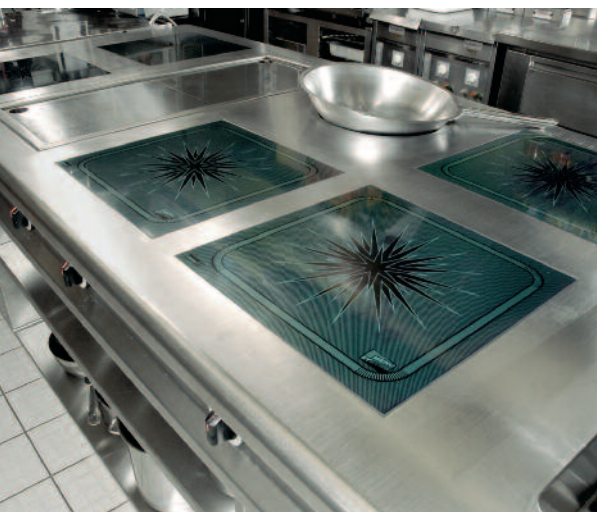
40 Prozent wollen in ihre Kücheneinrichtungen investieren.

Die Wirtschafts- und Konjunktur-Auguren schauen nicht mehr so pessimistisch in die Zukunft wie auch schon. Vor allem für die allgemeine Entwicklung der Schweizer Wirtschaft sind die Konjunkturanalysten zuversichtlicher geworden.