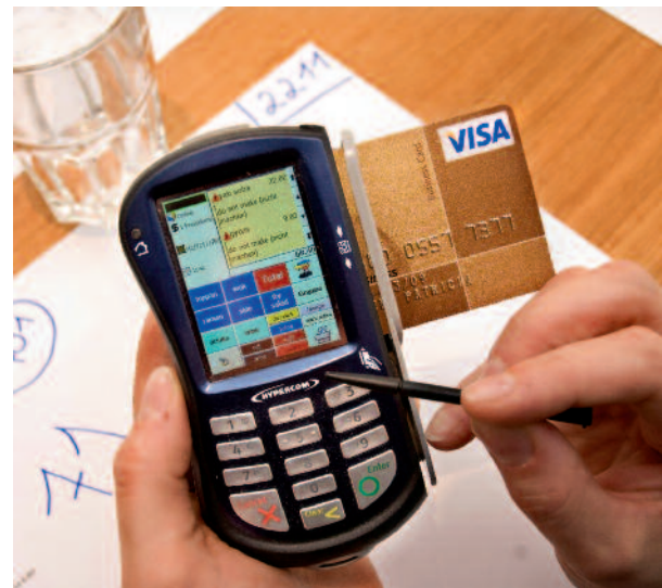
21 Prozent der investitionswilligen Befragten erklärten, sie wollten in Service- und Controlling-Einrichtungen investieren.