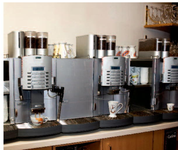
15 Prozent wollen Investitionen und Anschaffungen in der Getränke- und Kaffeeausschanktechnik ins Auge fassen.

Ein gutes Zeichen für die Hotellerie und Gastronomie — und auch für deren Zulieferanten!