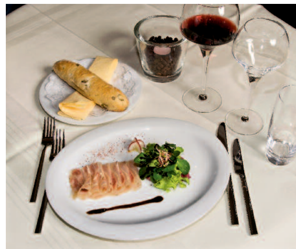
25 Prozent sagten, sie würden vor allem in neues Table Top investieren.

▶ Und 40 Prozent wollen in die Erneuerung und Erweiterung ihrer Kucheneinrichtungen und in die Kälte- und Küchentechnik investieren und hinter den Kulissen Anschaffungen tätigen.